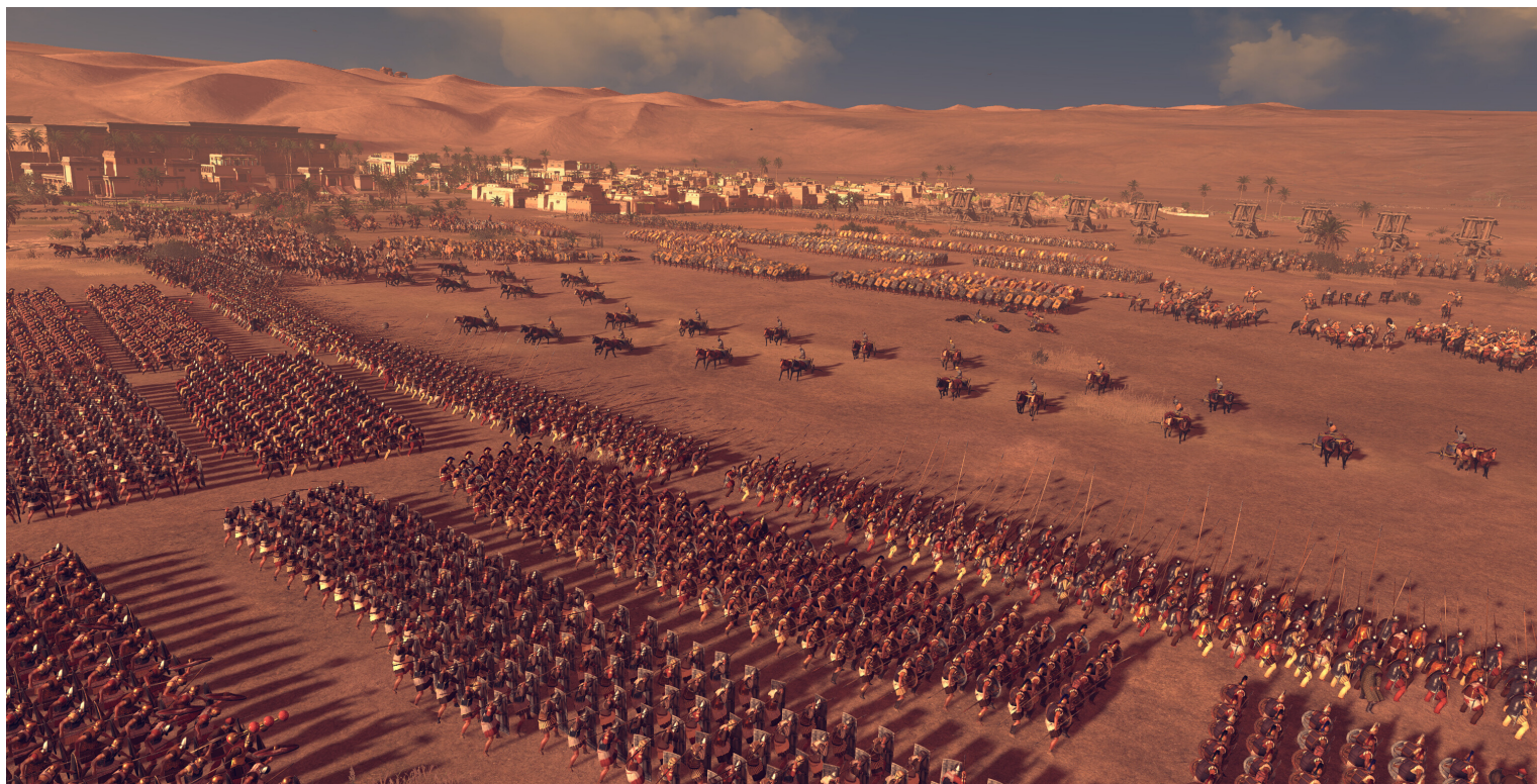
КАДР ИЗ ИГРЫ "РИМ 2. ТОТАЛ ВАР"

Причина, подтолкнувшая меня написать данную статью, с одной стороны смешная, с другой стороны — грустная. Это еще продолжающиеся со стороны консерваторов, мракобесов, религиозных фанатиков нападки на различные современные новшества, которые включают в себя не только интернет, но и видеоигры. Избитый тезис о том, что новое и неизвестное в некоторых людях пробуждает страх и желание это поскорее уничтожить, поскорее избавиться от этих новшеств, здесь подтверждает свою правоту.